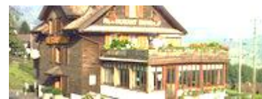
Restaurant Bahnhofli Steinerstr. 8, 6416 Steinerberg www.bahnhofli-steinerberg.ch